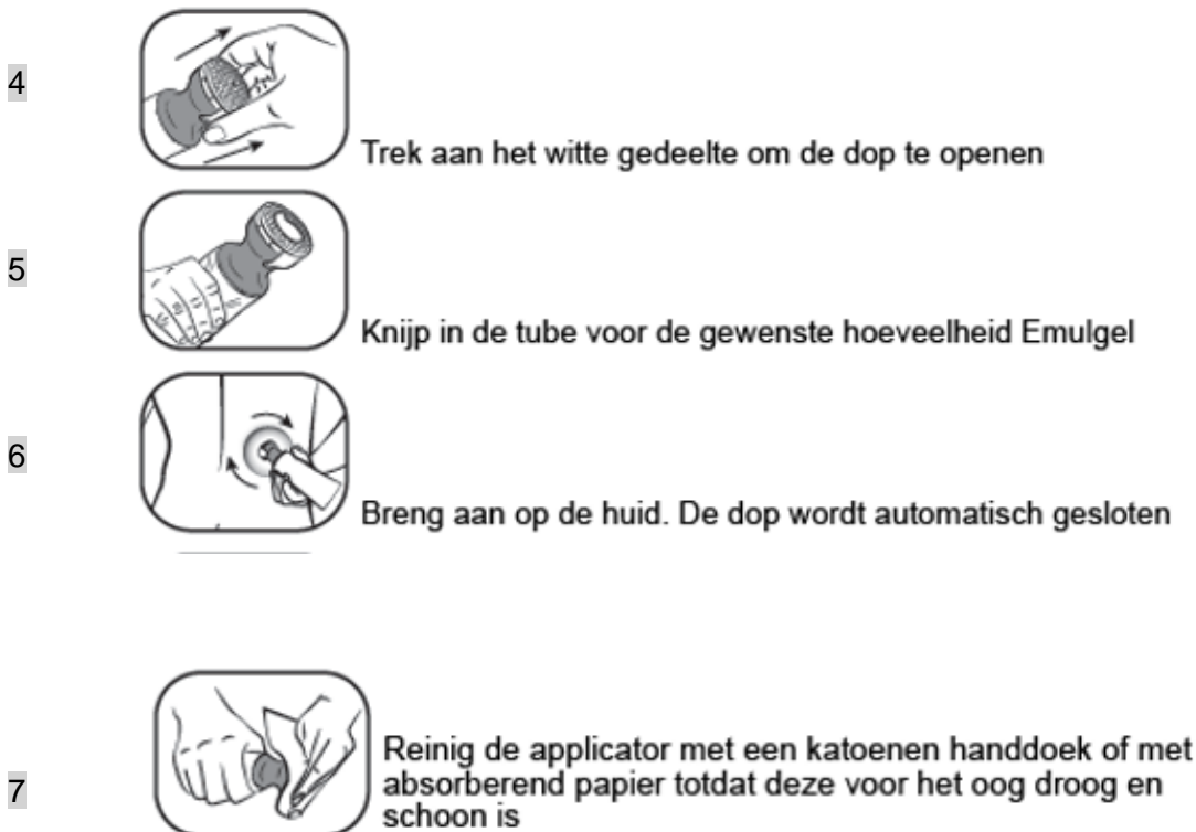
Figuur 2: Doseer- en smeerdop instructie stap 4 t/m 7

Gebruik de applicator niet opnieuw voor een andere tube. Volg bij het weggooien van de tube de in uw land geldende regels voor het weggooien van medicijnen.